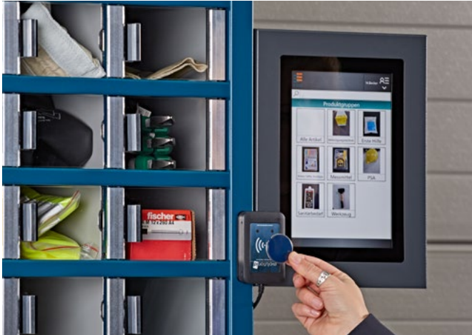
Anmeldung mit RFID-Chip, Produktgruppenübersicht

Unser neues Programm deckt den immer größer werdenden Bedarf an schnell verfügbaren, wirtschaftlichen Ausgabeautomaten ab, die für eine Vielzahl von Produkten geeignet sind: Werkzeuge, Arbeitsschutz, Industriebedarf und vieles mehr.