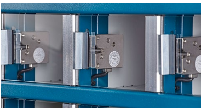
Der ETT BASIC verfügt über langlebige Verschlussmechanik