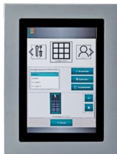
Konfigurationsmenü für Administratoren