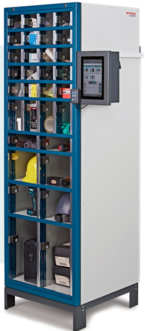
Das ETT BASIC Modul lässt sich einfach seitlich an einen Automaten montieren