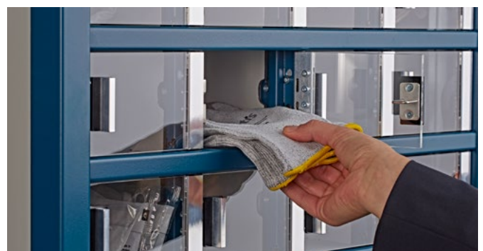
Diverse Fachgrößen für unterschiedliche Produkte